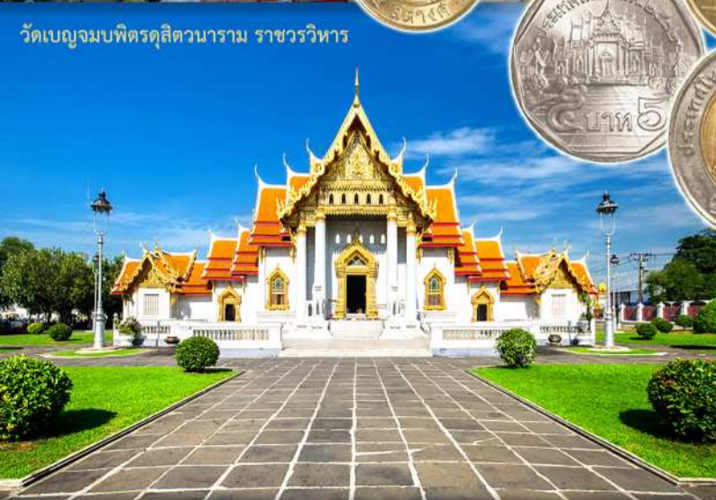
วัดเบญจมบพิตรดุสิตวนาราม ราชวรวิหาร