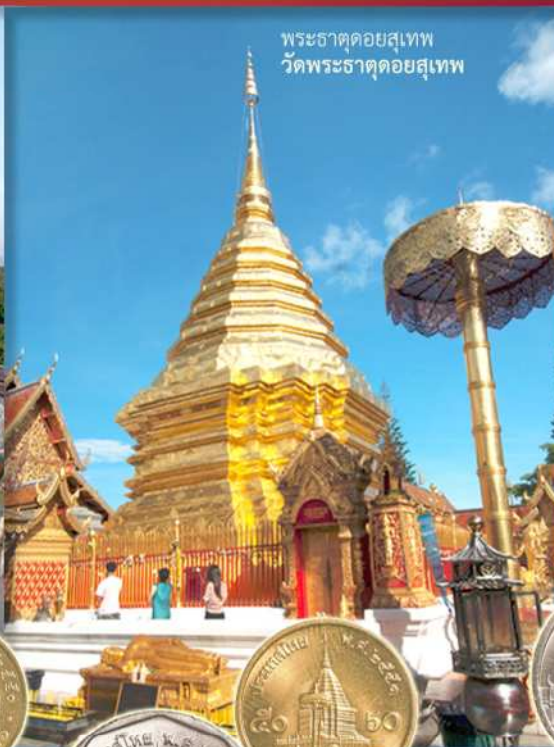
พระธาตุคดยสุเทพ วัดพระธาตุคดยสุเทพ