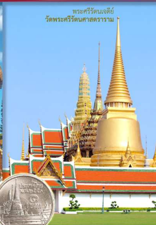
พระศรีรัตนเจดีย์ วัดพระศรีรัตนศาสดาราม