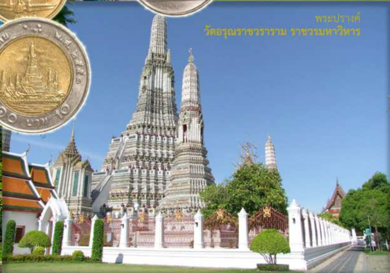
พระปรางค์ วัดอรุณราชวราราม ราชวรมหาวิหาร