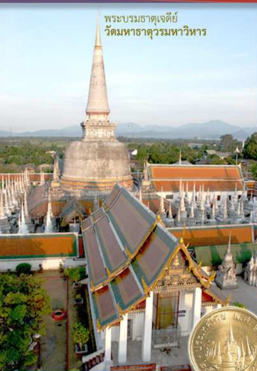
พระบรมธาตุเจดีย์ วัดมหาธาตุวรมหาวิหาร