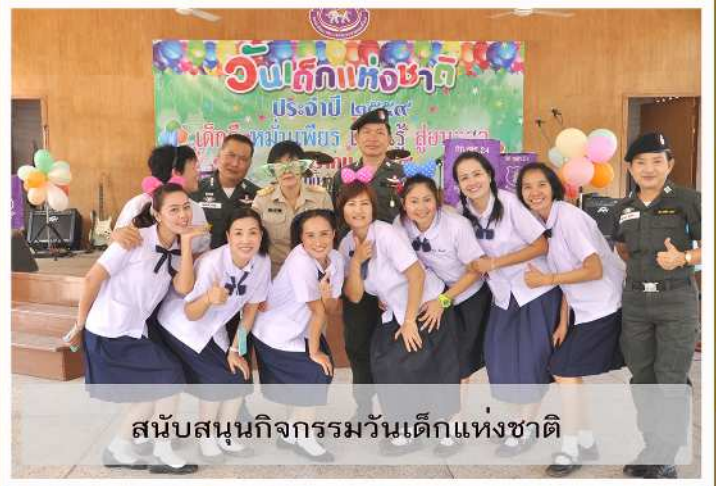
สนับสนุนกิจกรรมวันเด็กแห่งชาติ