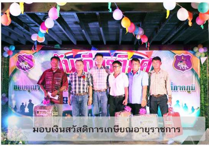
มอบเงินสวัสดิการเกษียณอายุราชการ