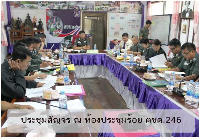
ประชุมสัจจร ณ ห้องประชุมร้อย ตชด.246