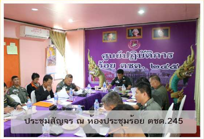
ประชุมสัจจร ณ ห้องประชุมร้อย ตชด.245