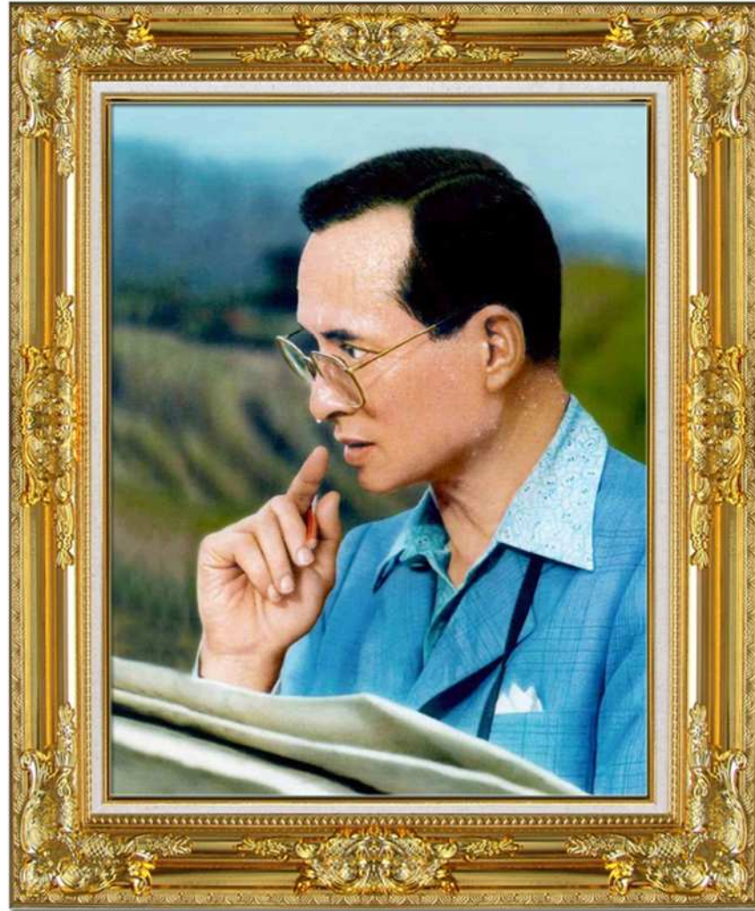
พระราชดำรัส พระบาทสมเด็จพระเจ้าอยู่หัว

สหกรณ์ แปลว่า การทำงานด้วยกัน หมายถึง ผนึกกำลัง ผู้ทำงานเกี่ยวข้องกัน การทำงานที่เกี่ยวข้องกันนั้นให้พร้อมกันทุกด้าน และต้องกระทำงานนั้น ด้วยความรู้ความสามารถ ด้วยความซื่อสัตย์ สุจริต ด้วยความเมตตาหวังดี เอื้อเพื่อเอื้อแก่กันและกัน จึงจะเป็นสหกรณ์แท้ ซึ่งมีแต่ความเจริญก้าวหน้า และอำนวยประโยชน์อันพึงประสงค์