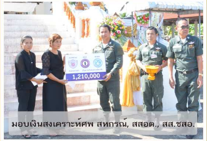
มอบเงินสงเคราะห์ศพ สหกรณ์, สสอต., สส.ชสอ.