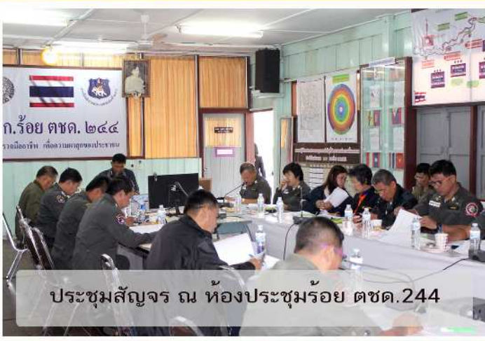
ประชุมสัจจร ณ ห้องประชุมร้อย ตชด.244