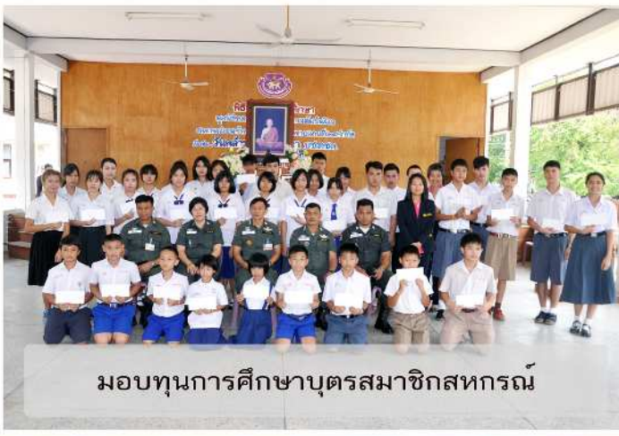
มอบทุนการศึกษาบุตรสมาชิกสหกรณ์