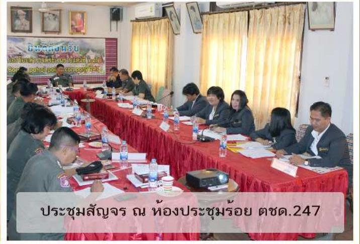
ประชุมสัจจร ณ ห้องประชุมร้อย ตชด.247